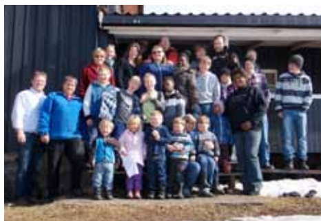
Over: Sju familier på tur til Nordtangen t.v.: "Mythbusters" eksperiment med brus og mentos. Hvilken brus var det mest fult i?

pølser og drakk solbærtoddi. Så ble det «mythbusters», da hadde vi flaskerakett og testa ut hvilken cola det spruta mest ut av når vi puta oppi en mentos. Cola light vant! Så gikk vi inn å lekte. Vi fikk taco til middag.