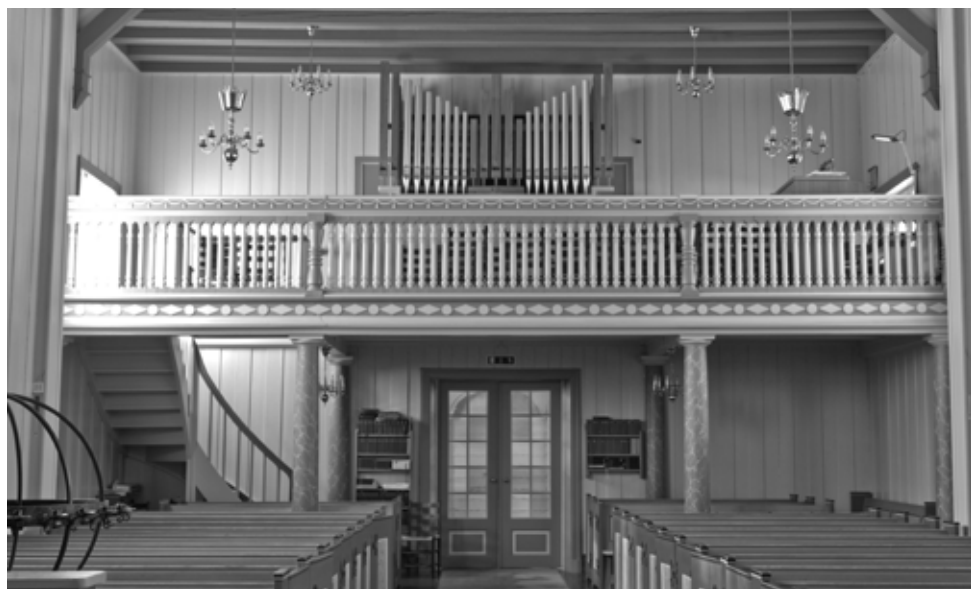
Orgelgalleriet i Hakadal kirke med fasaden til det nåværende orgelet.

Neste skritt på veien er anbudsinvitasjon, og orgelkonsulenten skal revidere anbudspapirene som så sendes til kirkevergen. Når anbudene foreligger, skal komiteen og orgelkonsulenten velge ut det firmaet som får oppdraget. Finansieringen av orgelet er snart fullført, og menigheten i Hakadal kan se fram til en riktig orgelfest i forbindelse med innvielsen.