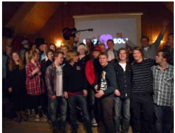
Litt av jubel skaren- nå på foto i Fjellhammer.