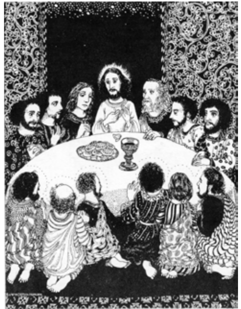
Birgitte Hendil: Nattverd. Gjengitt med tillatelse.